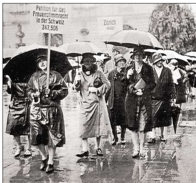
Ina petiziun a favur dal dretg da votar da las dunnas vegn inoltrada (Berna, 1929).

Il 1968, l'onn internaziunel dals dretgs umans, han las feministas protestà encunter il plan dal Cussegl federal da sutscrivere la Convenziun europeica dals dretgs umans (CEDU) mo cun resalvas (surtut causa la mancanza dal dretg da votar da las dunnas). Las dunnas han fatg valair ch'era ils dretgs politics sajan dretgs umans.